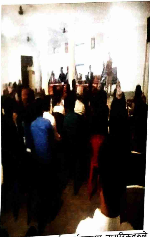
सार्वजनिक सुनुवाई कार्यक्रममा नागरिकहरुले जवाफदेहि वक्ताहरुसग आफना जिज्ञासा राख्दै ।